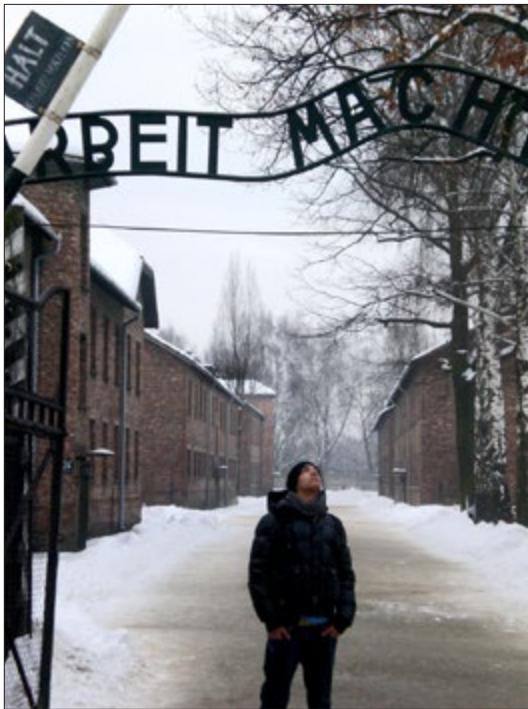
Fig. 5. Viaggio della memoria Istoreco 2015

È in questa fase del resto che si consolida anche la riflessione sui “luoghi della memoria”; e che quindi trovano riconoscimento pubblico e si istituzionalizzano come mete turistiche anche i “luoghi di memoria”. Indicativo quanto avviene proprio in Emilia: nel 1996 il Comune di Carpi e l'Associazione amici del museo monumento al deportato costituiscono una Fondazione, con l'obiettivo di con-