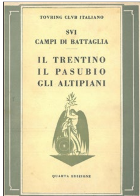
Fig. 2. Guida Touring sui campi di battaglia della Prima guerra mondiale

Nuovi luoghi, nuovi martiri, nuovi rituali caratterizzano i viaggi devozionali nel periodo successivo. Un flusso notevole, che, come ci spiega qui Bollini, giunge anche dalla Romagna, alimentato soprattutto dalle associazioni reducistiche e dal “turismo di guerra”. Già nel 1919 era possibile trovare sul mercato le prime guide turistiche nei luoghi teatro del primo conflitto mondiale. A immetterle fu l'azienda di pneumatici Michelin che non si limitò a produrre quattro volumi per l'Italia, ma stampò contemporaneamente (unifor-