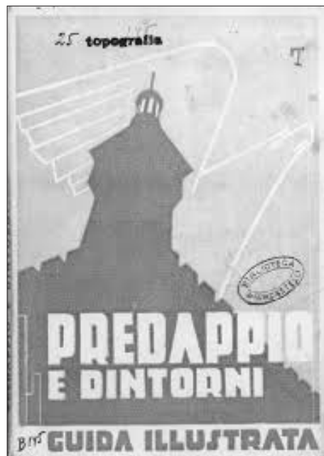
Fig. 3. Guida illustrata di Predappio 1937

A differenza del periodo precedente, ogni città possedeva ora almeno una propria meta minore: i viali (o parchi) delle rimembranze istituiti in memoria dei caduti della Grande guerra e i cippi dove caddero i "martiri" della rivoluzione fascista rappresentano solo alcuni esempi di una nuova ridefinizione urbana dove pellegrinaggio laico e turismo del consenso iniziarono a intrecciarsi. A testimoniarlo sono ancora una volta le numerose guide turistiche prodotte in questo periodo, nelle quali rispetto al passato, ciò che deve essere visto viene stravolto, uscendo dai classici canoni storicamente battuti. Il percorso, non di rado, veniva deviato lungo edifici eretti dal regime per il suo popolo. Le guide dell'Africa Orientale Italiana stampate sul finire degli anni Trenta non furono esenti da tale impostazione.