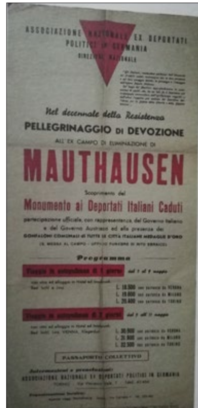
Fig. 4. Locandina viaggio Aned 1955