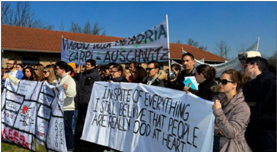
Fig. 6. Treno per Auschwitz Fondazione Fossoli 2015

Nel 2005 esordisce anche il Treno per Auschwitz di Fossoli (di cui ci parla qui Mantovani), proseguito fino al 2016 e poi sostituito dal progetto Storia in Viaggio . Nello stesso anno l'Università di Roma Tre inaugura il primo Master in Didattica