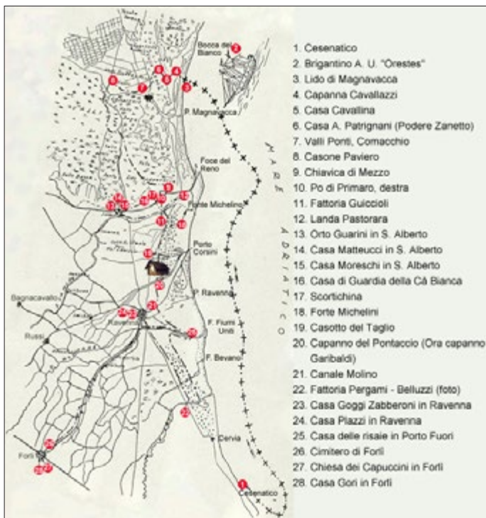
Fig. 1. La trafila garibaldina romagnola

1882] e, dopo il 1882, per venerarne casa e tomba [Cavallotti 1887; Romussi 1892; Terzo pellegrinaggio 1897; Caprera 1907]. Tutt'altro che agevoli apparivano anche le gite a Bezzecca [Un convegno ciclistico a Bezzecca 1902], per la quale occorreva oltrepassare l'«insidioso» confine. Varcato quindi più raramente, quest'ultimo si poneva come meta di un simbolico incrocio: da sud verso nord era attraversato da irredentisti italiani che salivano sul colle di San Giusto (Trieste) o si facevano fotografare ai piedi della statua di Dante a Trento; in direzione nord verso sud da ciclisti provenienti dalle terre escluse dal processo unitario, che si spingevano – accolti festosamente dai consigli locali e dalle bande municipali – in città simboliche dell'italianità come Mantova, Verona e Ravenna [ Ravenna a Garibaldi 1907; Il pellegrinaggio garibaldino 1907]. In quest'ultima la destinazione, tuttavia, non era solo il capanno di Anita (di cui si occupa il saggio di Mattarelli; si veda anche fig. 1), bensì la tomba di Dante, dove lasciare una “offerta votiva” (una di queste è ancora oggi visibile) [ L'album fotografico 1908].