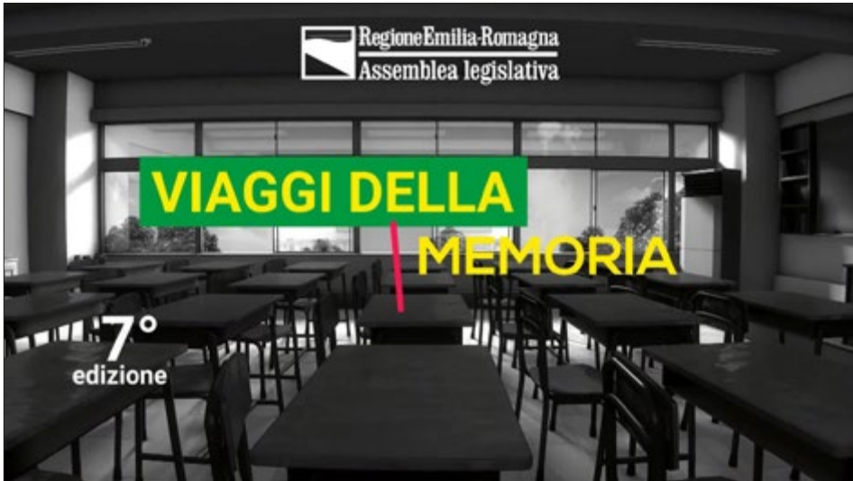
Fig. 8. Bando Assemblea legislativa Emilia-Romagna

per mezzi, svolgimento e mete, ma sempre più anche per tipologia di utenti (docenti e studenti – pochi universitari – ma anche pensionati e operatori) e proponenti (associazioni e istituti, ma sempre più anche scuole o cooperative sociali); per durata e periodi di svolgimento; per obiettivi formativi (non più solo storici e turistici, ma anche legati alla pace, ai diritti umani, alla multiculturalità).